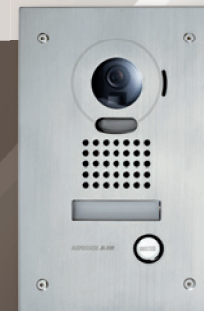
JODVF (302950) Platine encastrée