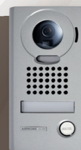
JODV (302949) Platine saillie