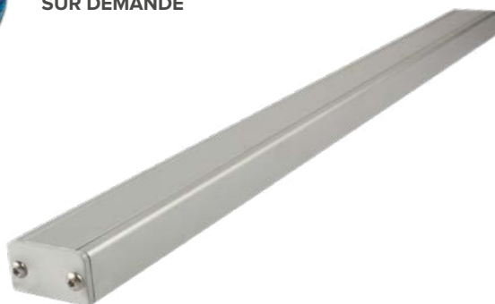
➤ Renfort simple EMDH...SR