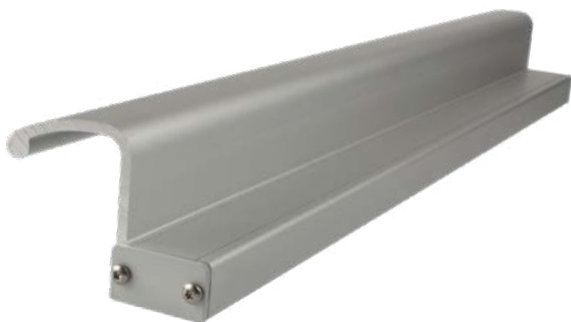
➤ Renfort poignée EMDH...HR