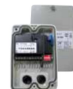
1 RÉCEPTEUR HF (étanche, antenne intégrée, 2 relais)