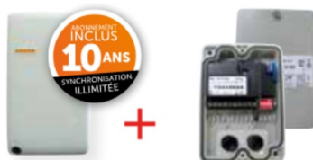
1 MODULE GPRS

Permet de passer à un mode de gestion en temps réel et à distance : RÉCEPTEUR HF (07-0106) et LECTEUR DE PROXIMITÉ (04-0104 + 1 carte relais 12-0110)