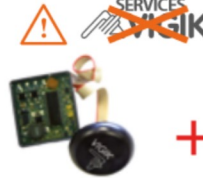
1 LECTEUR de badges 04-0104