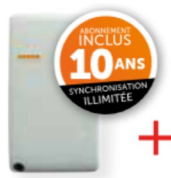
1 MODULE GPRS